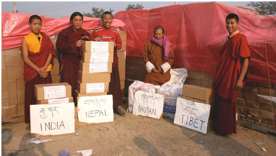
pelgrims en hun land van bestemming met op de achtergrond bergen van boeken voor kloosterbibliotheken

Hij had nog nooit gehoord van boeken die uit het westen kwamen en die in Bodhgaya, in India tijdens de Grote Ceremonie voor de Wereldvrede gratis zouden worden uitgedeeld aan Tibetanen. Hij woonde in Dolpo, ergens ver weg in de bergen van Nepal, tegen de grens met Tibet (China) aan. Het gerucht ging dat complete sets van de Prajnaparamita boeken (Kennis van hoogste wijsheid) zouden worden uitgereikt, niet alleen aan kloosterlingen maar ook aan leken! Samen met een vriend ging hij op weg. Ze bereikten Bodhgaya tijdens de Grote Ceremonie in februari. Voor het eerst in de geschiedenis werden daar de complete Prajnaparamita boeken aan individuele leken gegeven. Het gerucht klopte dus en beide vrienden ontvingen zeven dozen met de 27 boeken. Ze worden geïnterviewd voor een camera door iemand die hun taal spreekt. Het lijkt alsof ze niet geloven wat ze meemaken. Hoe zullen zij de boeken thuis krijgen? De boeken zijn zwaar en ze hebben geen geld. Met de dozen op hun rug gebonden gaan ze op weg. De weg van Kathmandu naar Dolpo doen ze te voet, om geld uit te sparen. Het duurt één maand om van Kathmandu naar Dolpo te lopen, maar ze gaan het wel doen. Deze boeken zijn zó kostbaar. Zelfs al je ze niet kan lezen is het een zegen om in de nabijheid van deze boeken te zijn. Ze bevatten immers een boodschap van mededogen en vrede voor alle mensen! En zo zijn de boeken naar huis gekomen.